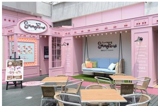
(3密対策にもなり、テラス席も人気です)

「自由が丘スイーツフォレスト」で、日本の季節の訪れが実感できる限定スイーツをぜひご堪能ください。