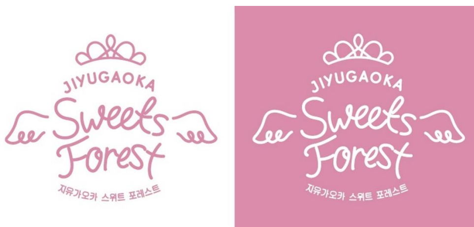
▲「自由が丘スイーツフォレスト」新しいロゴ（2パターン）

「自由が丘スイーツフォレスト」のテーマカラーであるピンクを用い、自由が丘駅前にある街の象徴ともいえる女神像をモチーフにした天使の羽とティアラで、自由が丘らしさを表現。新しい「自由が丘スイーツフォレスト」をお楽しみいただくお客様皆様に、光り輝く夢や希望を贈りたいとの願いを込めて、新しいロゴを誕生させました。