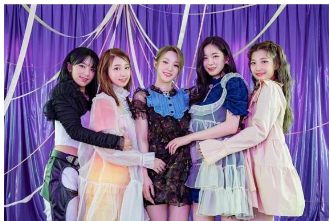
▲新施設アンバサダー「woo!ah!」