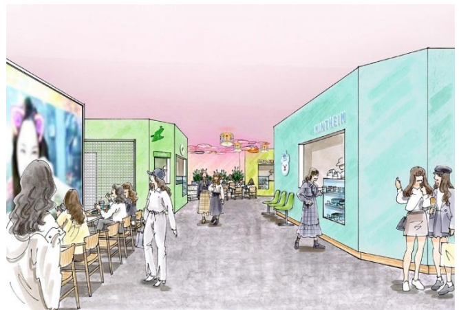
▲「自由が丘スイーツフォレスト」リニューアル内観（イメージ）