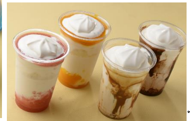
「きらきらゼリーポンチ」